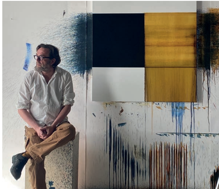
CALLUM INNES IN ZIJN ATELIER IN OSLO | 2020 | FOTO: NOC COFFEE CO

https://depont.nl/tentoonstelling/callum-innes-15-okt-2016-26-feb-2017